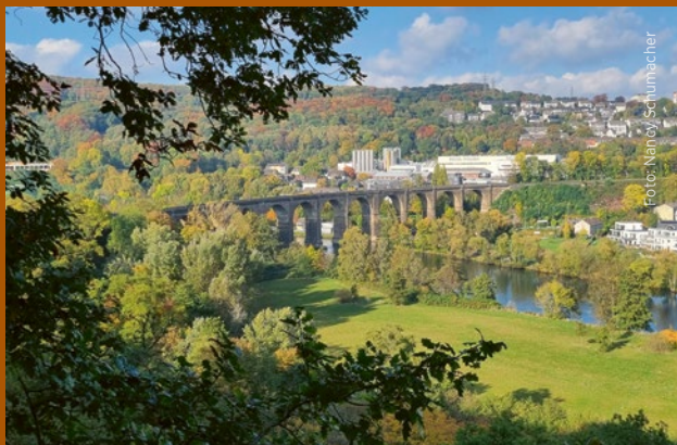
Panoramablick Richtung Ruhrviadukt und Herdecke am Geostopp 5

Der Geopfad Kaisberg ist ein gemeinsames Projekt des GeoParks Ruhrgebiet e. V. und der Stadt Hagen. Der Wanderweg wurde mit Mitteln des Landschaftsverbandes-Westfalen Lippe (LWL) gefördert.