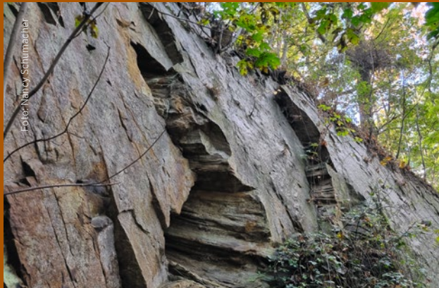
Fossiler Baumstamm am Geostopp 3