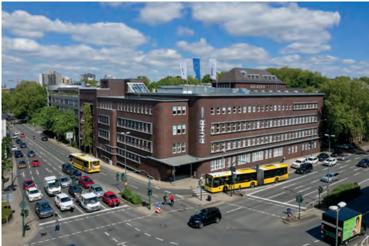
Der Hauptsitz des Regionalverbands Ruhr (RVR) in Essen (seit 1927).