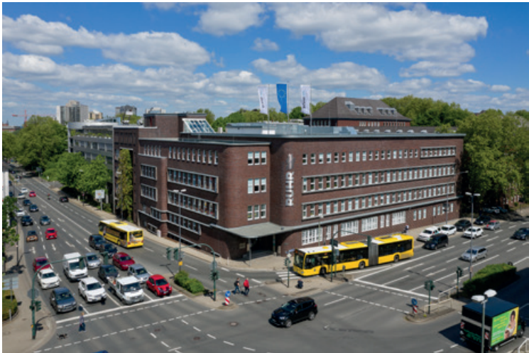
Der Hauptsitz des Regionalverbands Ruhr (RVR) in Essen (seit 1927).