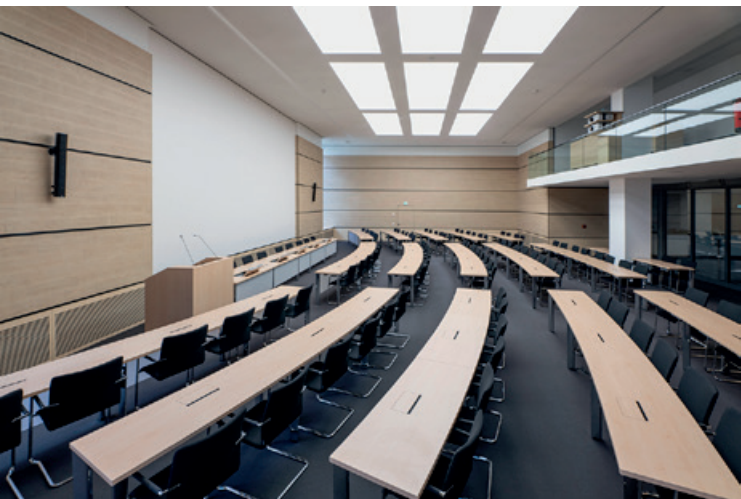
Plenarsaal der Verbandsversammlung

Er setzt sich zusammen aus den Oberbürgermeisterinnen/-meistern und Landrätinnen/-räten des Ruhrgebiets.